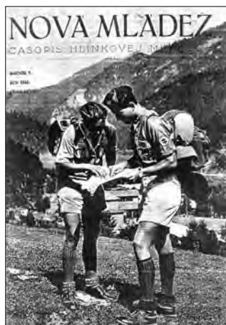
Titulná stránka 3. čísla 7. ročníka Novej mládeže.