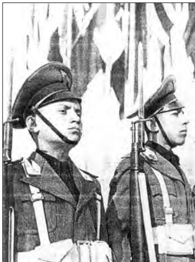
Tvár novej Európy – Talianski Avantgardisti (členovia vekovej kategórie v GIL ako junáci v HM).