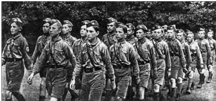
Pochod speváckej čaty orlov HM z Trnavy po privítaní hlavného veliteľa HM A. Macka v Trnave, 1942.

(Zdroj: Nová mládež, roč. 5, 1943, č. 7, s. 32.)