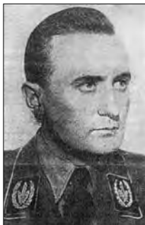
Artur Axmann, ríšsky vodca nemeckej organizácie mládeže HJ

Príloha 12.2: Vodcovia zahraničných mládežníckych organizácií (1942)