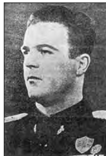
Aldo Vidussoni, generálny tajomník talianskej fašistickej strany a hlavný veliteľ talianskej GIL