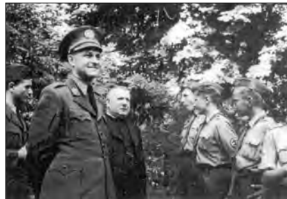
Návšteva prezidenta SR Jozefa Tisa v tábore HM.