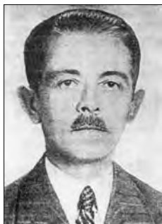
Generál Viktor Iliescu (Rumunsko)