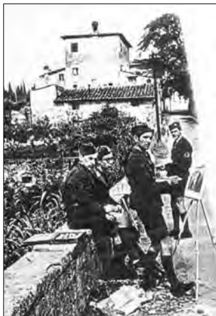
Maliari HM na kultúrnej manifestácii vo Florencii, 1942.

Príloha 12.5: Styky HM so zahraničnými organizáciami