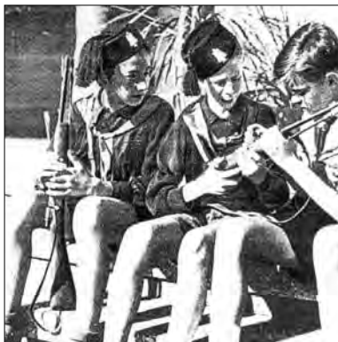
Tvár novej Európy: Talianska Ballila (členovia vekovej kategórie v GIL ako orlí HM).