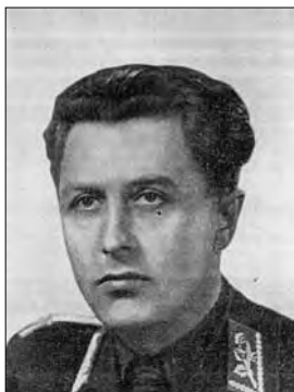
Minister vnútra a hlavný veliteľ HG Alexander Mach.