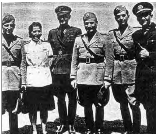
Tvár novej Európy: Najvyšší vodcovia GIL s vodcami HM.