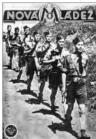
Titulná stránka 2. čísla 5. ročníka Novej mládeže.