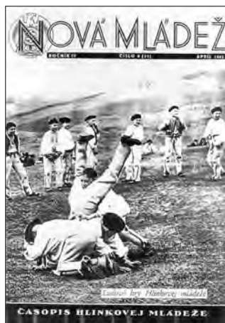
Titulná stránka 8. čísla 4. ročníka Novej mládeže.

Príloha 11.3: Zmeny a úpravy titulnej strany Novej mládeže 1939 – 1944