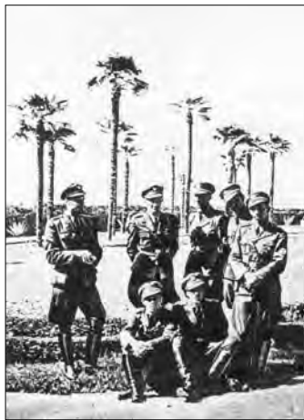
Poslucháči VVŠHM v Taliansku, 1942.