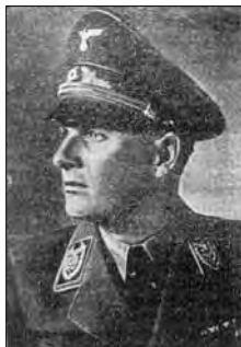
Baldur von Schirach, bývalý ríšsky vodca nemeckej organizácie mládeže HJ