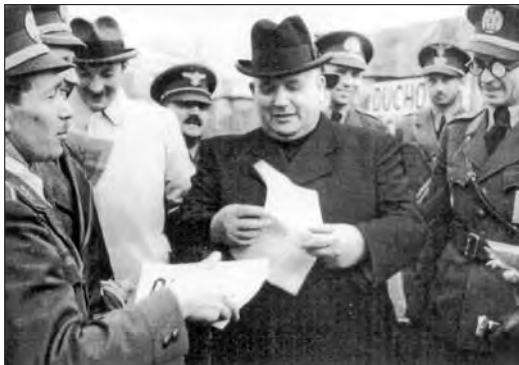
Prezident SR a najvyšší veliteľ HM Jozef Tiso medzi činníkmi HM.

Jozef Tiso, Vojtech Tuka, Alexander Mach