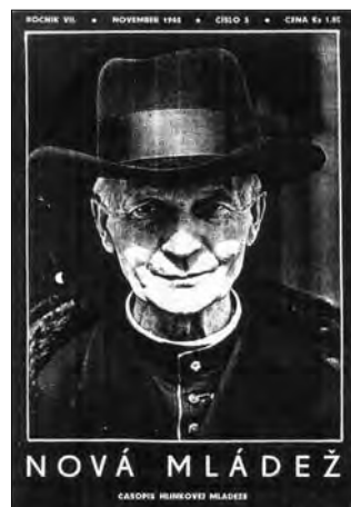
Titulná stránka 10. čísla 5. ročníka Novej mládeže. Opäť zmena hlavičky – tentoraz v 5. ročníku časopisu.