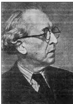
Predseda vlády SR a krajinský veliteľ HM Vojtech Tuka.