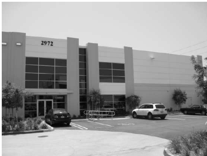
Kanceláře v Kalifornii...

Získal jsem hodně zkušeností s tím, jak shánět nájemníky a jak řešit problémy. Nemovitosti mi výrazně pomohly k úspěchu. V USA je tolik příležitostí, jak investovat a získat finance, že to je skoro přehlucující. Jen o investování do nemovitostí bych mohl napsat samostatnou knížku. Ale to třeba někdy příště.