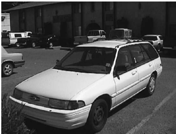
Mé první auto v USA, které jsem koupil za $ 2 300.

downpayment (základní splátku) bytu, který si sám koupím? Na downpayment stačilo zhruba $ 5 000, které jsem při troše nepohodlí v malém bytě ušetřil na nájmu.